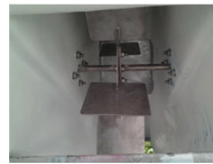
ใบจักรและหางเสือSS304 ติดตั้งใต้ท้องเรือ