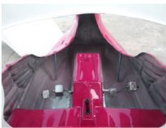
ภายในที่นั่งและคันเกน