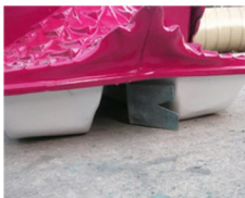
หางเล็วมังคับที่สหาง