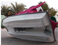
ห้องเครื่องและชุดขับไดนาโม

- ชุดขับและหางเสือสั่งพิเศษในจักร แกนชกและหางสแตนเลส สำหรับรุ่นสแตนเลส และรุ่นสแตนเลส+ 2K -